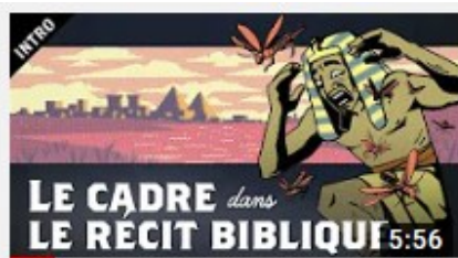
Le Cadre dans le Récit Biblique