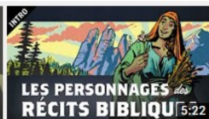
Les Personnages des Récits Bibliques