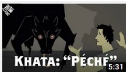
Khata / Pêché