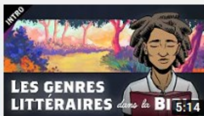
Les Genres Littéraires dans la