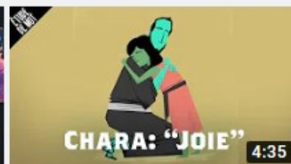
Chara / Joie