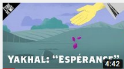
Yakhal / Espérance